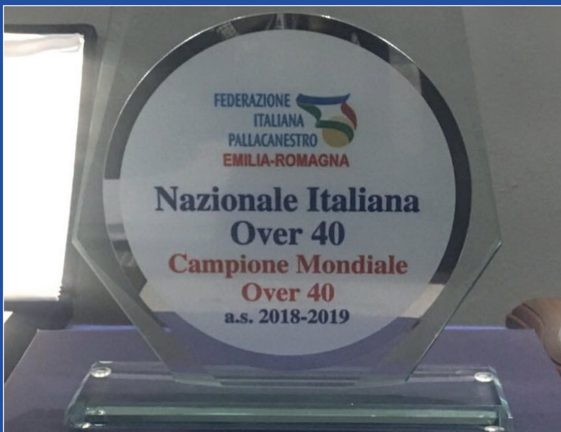
Trofeo consegnato alla Nazionale Italiana di Pallacanestro Over 40 campione del mondo dal presidente della Fip Gianni Petrucci

Una media di 18.000.000 di contatti registrati tra il 2009 e il 2019 per le seguenti manifestazioni: Mondiale di Praga, Europeo di Zagabria, Mondiale di Nadal, Europeo di Kaunas, Mondiale di Salonicco, Europeo di Ostrava, Mondiale di Orlando, Europeo di Novi Sad, Mondiale di Montecatini Terme, Europeo di Maribor e Mondiale di Helsinki.